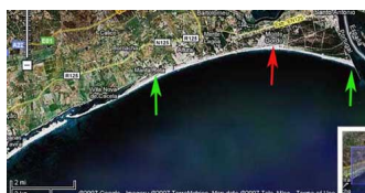
Mapa do Algarve

Significa isso que possui a capacidade de ver o astral, o que a torna um ser muito especial, atendendo que é raro encontrar pessoas que vêem o astral. Disse-nos igualmente que a sua visão também detecta a presença de fadas ao ar livre, como por exemplo em jardins.